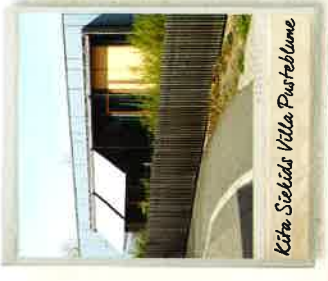
Kita Seelids Villa Pustebume