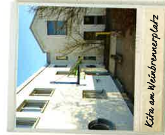
Kita am Weinbrennerplatz