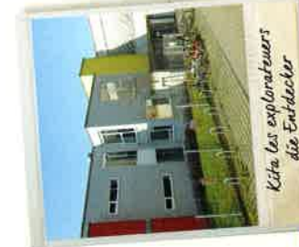
Kita les explorateurs die Entdecker