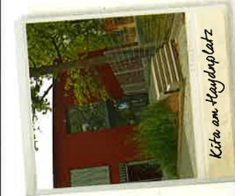
Kita am Haydnplatz