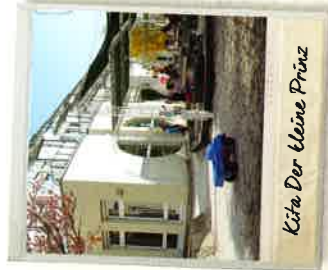
Kita Der Kleine Prinz