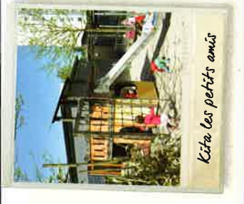
Kita Les petits amis