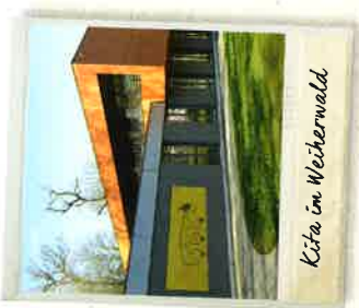
Kita im Weiherwald